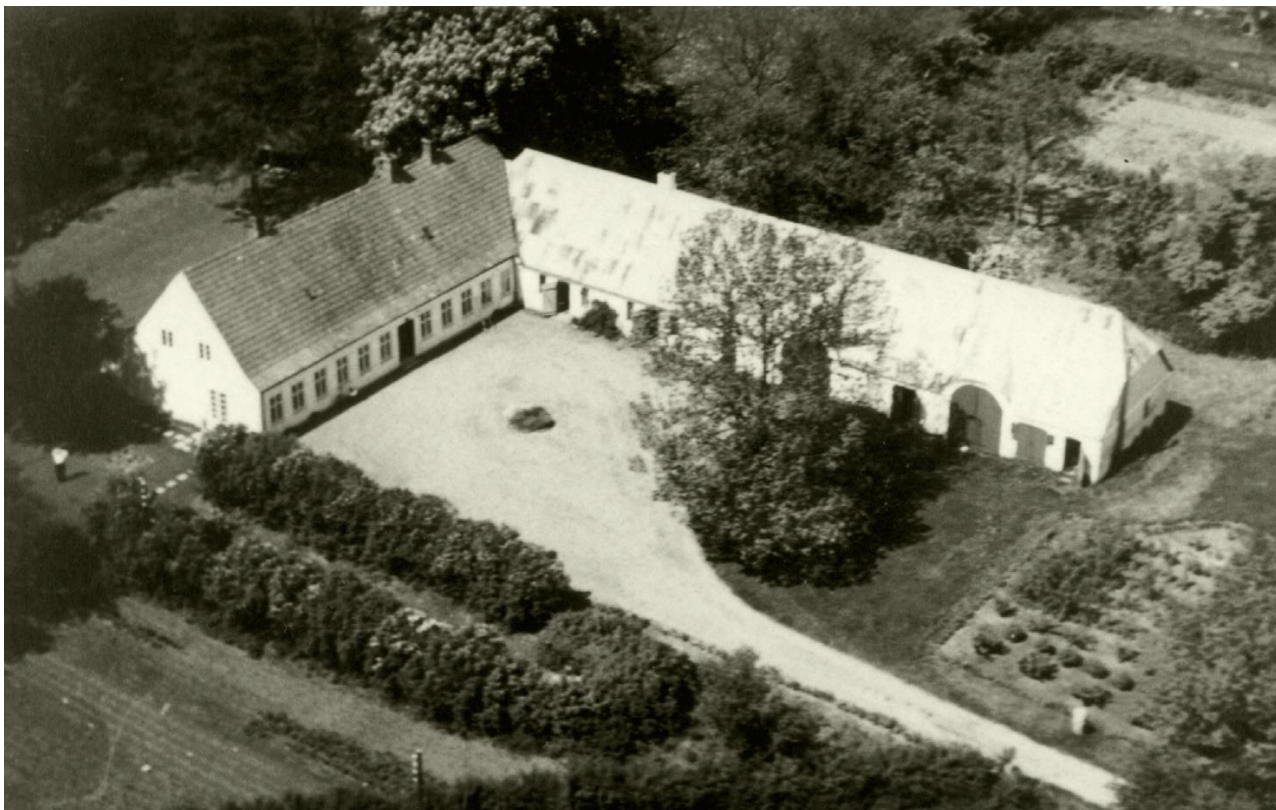
Maugstrup Præstegård 1957. Bemærk køkkenhaverne både mod syd og øst.

stole, som anbragtes på præstegårdens loft. Ingen var spurgt om dette antal og knap nok om, hvilken stol det skulle være. Arkitektens tanke var nok, at til sidst skal der spares på dette område. Her blev ikke sparet. Der blev fundet 12 mønter under harpningen.