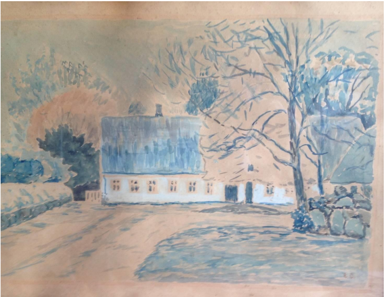
Maleri af Maugstrup Præstegård. Malet af Ernst Dalberg i 1950erne. (Maleriet er i familiens eje)