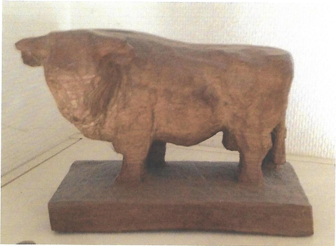
Træsnit udført af Ernst Dalberg i 1950erne. (i familiens eje)